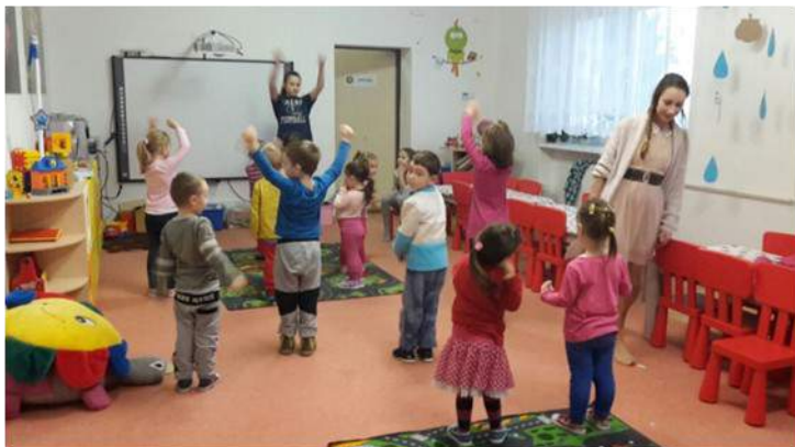
Tanečný krúžok - pod vedením tanečnej skupiny Piruett