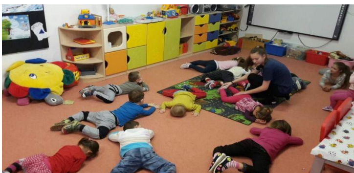
Aj takýto učiteľia učia naše deti...

Ďakujem Vám za spoluprácu prajem krásne prežitie Vianočných sviatkov a tešíme sa na Vás aj v Novom roku.. Deti a vedenie MŠ